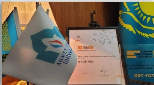
Университетіміз QS рейтингінде 714-ші орынға көтерілді