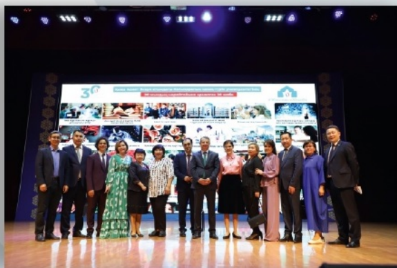
Университетіміздің 30 жылдығына арналған 30 жобаны таныстыру салтанаты