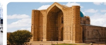
Түркі әлемі интеграциясындағы Түркістан концепциясы