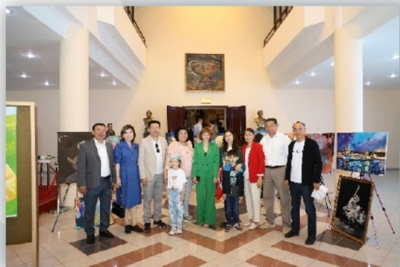
Әзірбайжан мемлекетінің Республика күні мен университетіміздің 30 жылдығына арналған сурет көрмесі