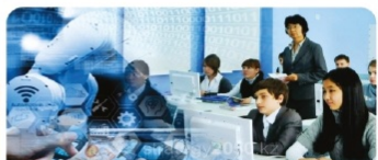
Инженерия саласы бойынша оқу зертханалары