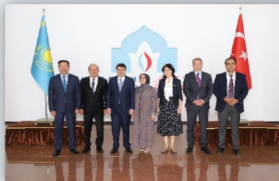
Анкара қаласының губернаторы Васип Шахин құрметті қонағымыз