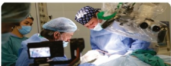
Ана жұрттан ата жұртқа - денсаулық көпірі