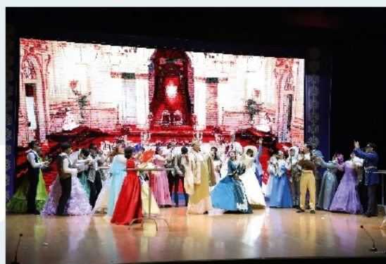
Студенттеріміз дипломдық жоба ретінде «Жарқанат» музыкалық комедиясын сахналады