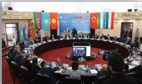
«Түркі Мемлекеттері Ұйымы» Түркі университеттері одағының IV Бас ассамблеясы