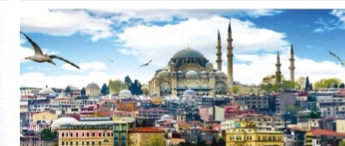
300 студентке шетелдік жазғы мектеп