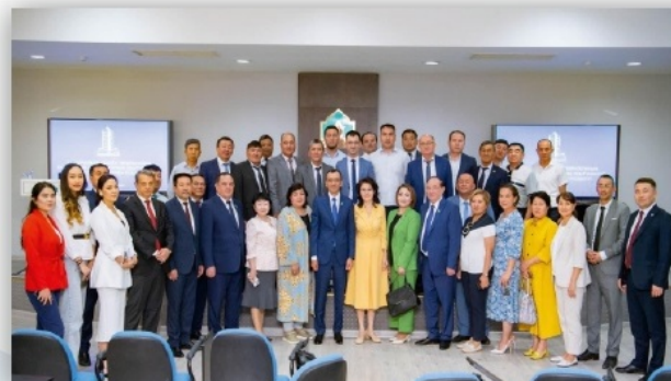
ҚР Парламенті Сенатының Төрағасы Мәулен Әшімбаев ұжыммен кездесті