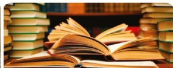
Ана жұрттан ата жұртқа білім көпірі: 100 оқулық