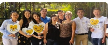
Туризм мамандығы студенттеріне Түркияда 3 айлық тағылымдама