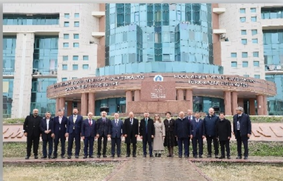
Түркия Республикасының Вице-президенті Фуат Октай мәртебелі мейманымыз