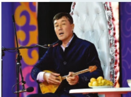
Түркістанның материалдық емес мәдени мұрасын зерттеу