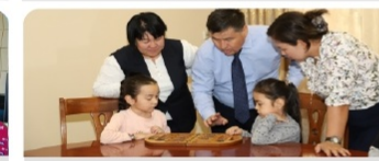
«Түркі халықтарының зияткерлік ойындары» орталығы