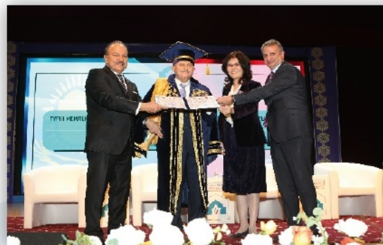
«Түркі Мемлекеттері Ұйымы» Ақсақалдар Кеңесінің Төрағасы Бинали Йылдырым – университетіміздің «Құрметті профессоры»!