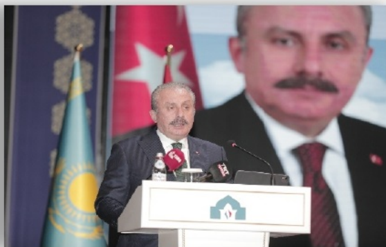
Түркия Республикасы Ұлы Ұлттық Мәжілісінің Төрағасы Мұстафа Шентоп университетімізге құрметті қонақ болды