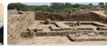
Сығанақ қалашығында археологиялық зерттеулер