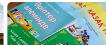
«Ахмет Ясауи тіл мектебі» шетелдіктерге қазақ тілі курстары