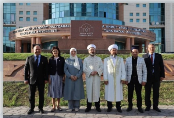
Қазақстан мен Түркияның Дінбасылары университетімізде құрметті қонақ болды