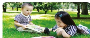
Балалар әдебиеті фестивалі