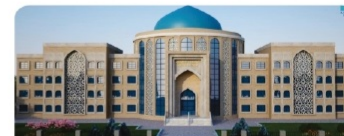
Теология факультеті және «Түркология» ҒЗИ ғимараты