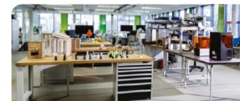
FABLAB оқу зертханасы