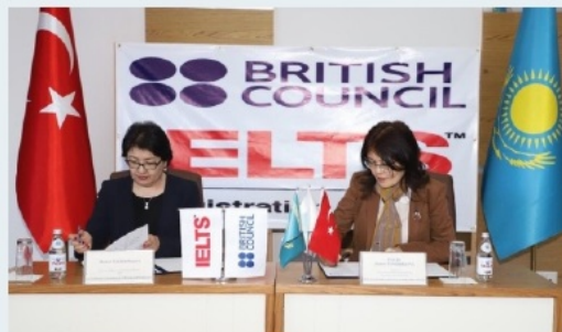
«BRITISH COUNCIL (KAZAKHSTAN)» ЖШС-мен меморандумға қол қойылды