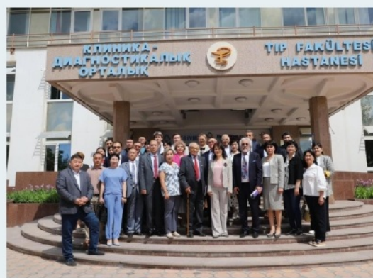
Клиника-диагностикалық орталықтың реновациясы