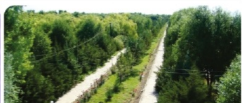
Ботаникалық бақ реконструкциясы