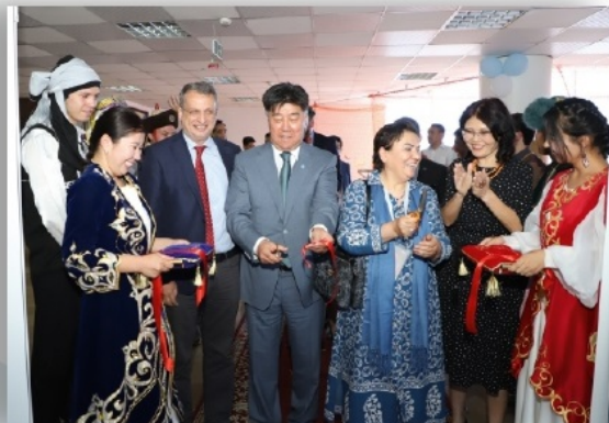
«Түркі халықтарының зияткерлік ойындары» орталығының ашылу салтанаты