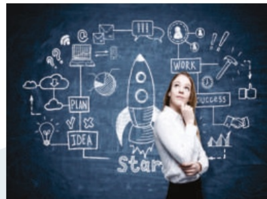
Кәсіпкерлік курстары: әйелдер мен жастарды жұмыспен қамту