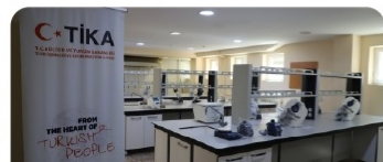
Медицина саласы бойынша оқу зертханалары