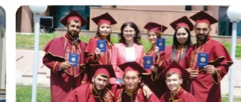
Бірлескен білім беру бағдарламалары