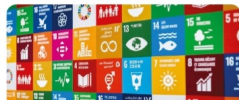
Тұрақты даму ғылыми-зерттеу орталығы