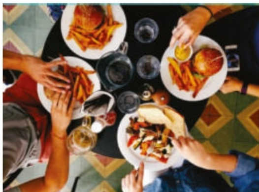
Қоғамдық тамақтану қызметі саласы бойынша кәсіби мамандарды даярлау курсы