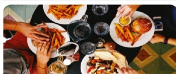
Қоғамдық тамақтану курстары