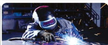
Дәнекерлеу оқу шеберханасы