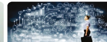
Кәсіпкерлік курстары: әйелдер мен жастарды жұмыспен қамту