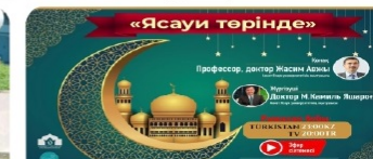
«Ясауи төрінде» бағдарламасы