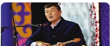
Түркістанның материалдық емес мәдени мұрасын зерттеу