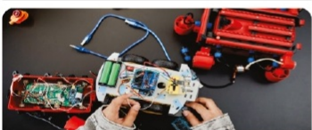
Роботтық техника кодтау шеберханасы