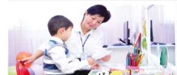
Инклюзивті білім беру орталығы