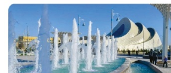
«Түркістан 2040: келешек келбеті» концепциясы