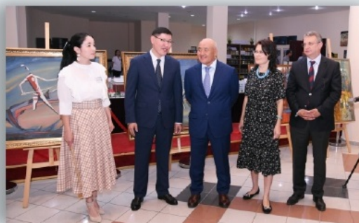
«Маңғыстаудан мың сәлем, Түркі төрі!» мәдени күндерінің ашылу салтанаты