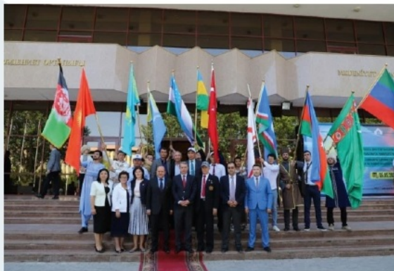
Түркі дүниесі жастарының «Достық» фестивалі